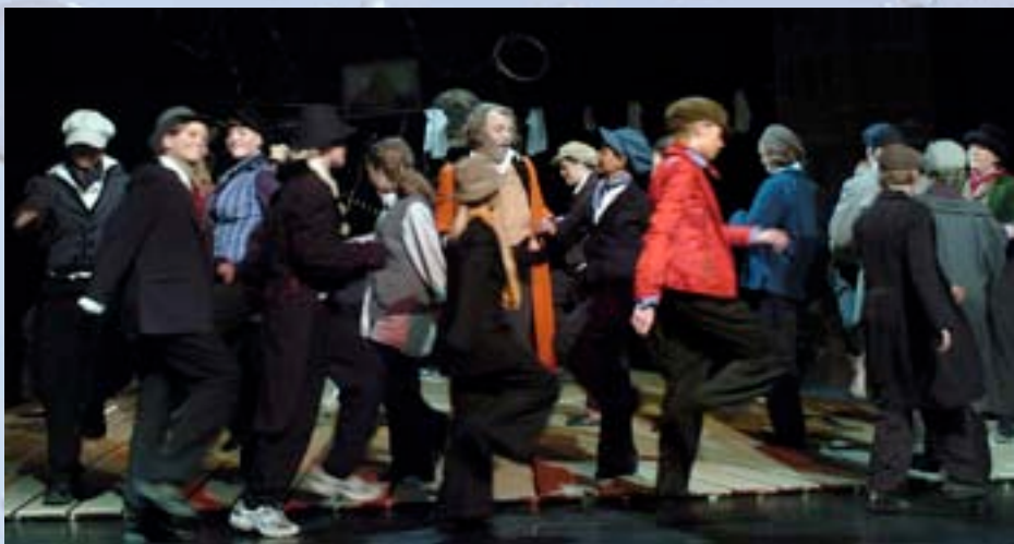
Frå musikalen OLIVER!

Turnètilbod frå Nistepakken er i utgangspunktet inkludert skyss. Ved vitjing av lokale kulturinstitusjonar vil ein prioritera oppleving, til dømes inngangsbillett, før skyss. Nistepakken er likevel open for å vera med og dekkja skysskostnader i særlege høve.