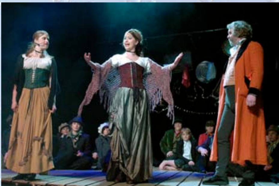
Frå musikalen Oliver!

Dei to neste sidene viser innhaldet i planen på dei ulike stega og ymse samarbeidspartnarar.